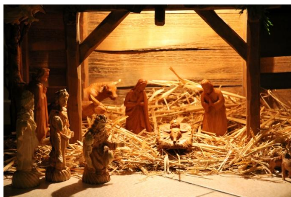
Erzbistum Köln (c) Axler

Gesegnete Weihnachten und ein glückliches und friedvolles Jahr 2026